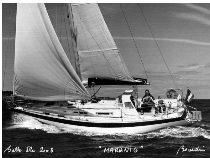
Le Gladiateur Marang