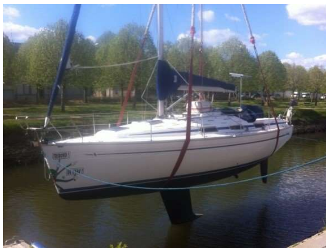
Le Bavaria 34 Pitou One II