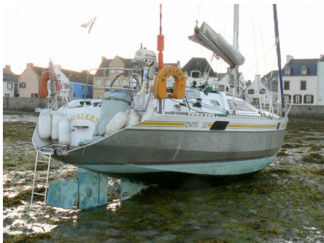
L'Ovni 32 Gwalarn