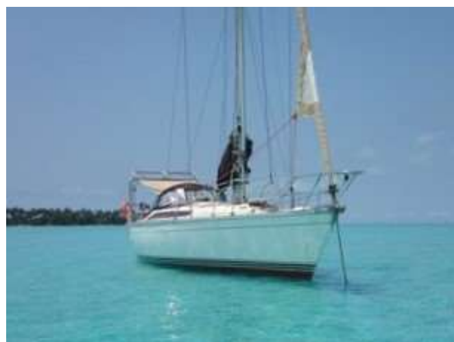
Le Sun Fizz Propolis